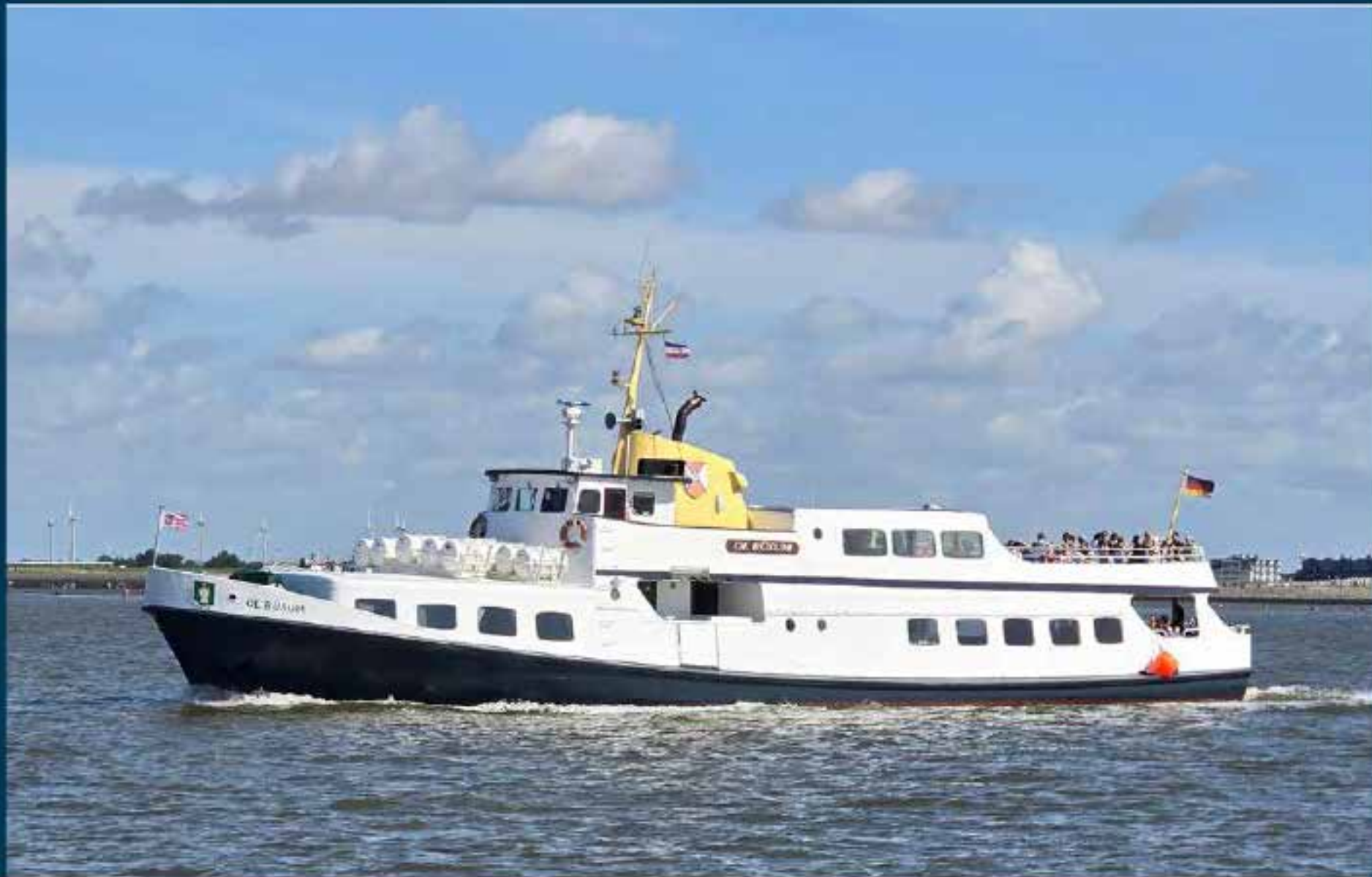
Letzte Ruhestätte See