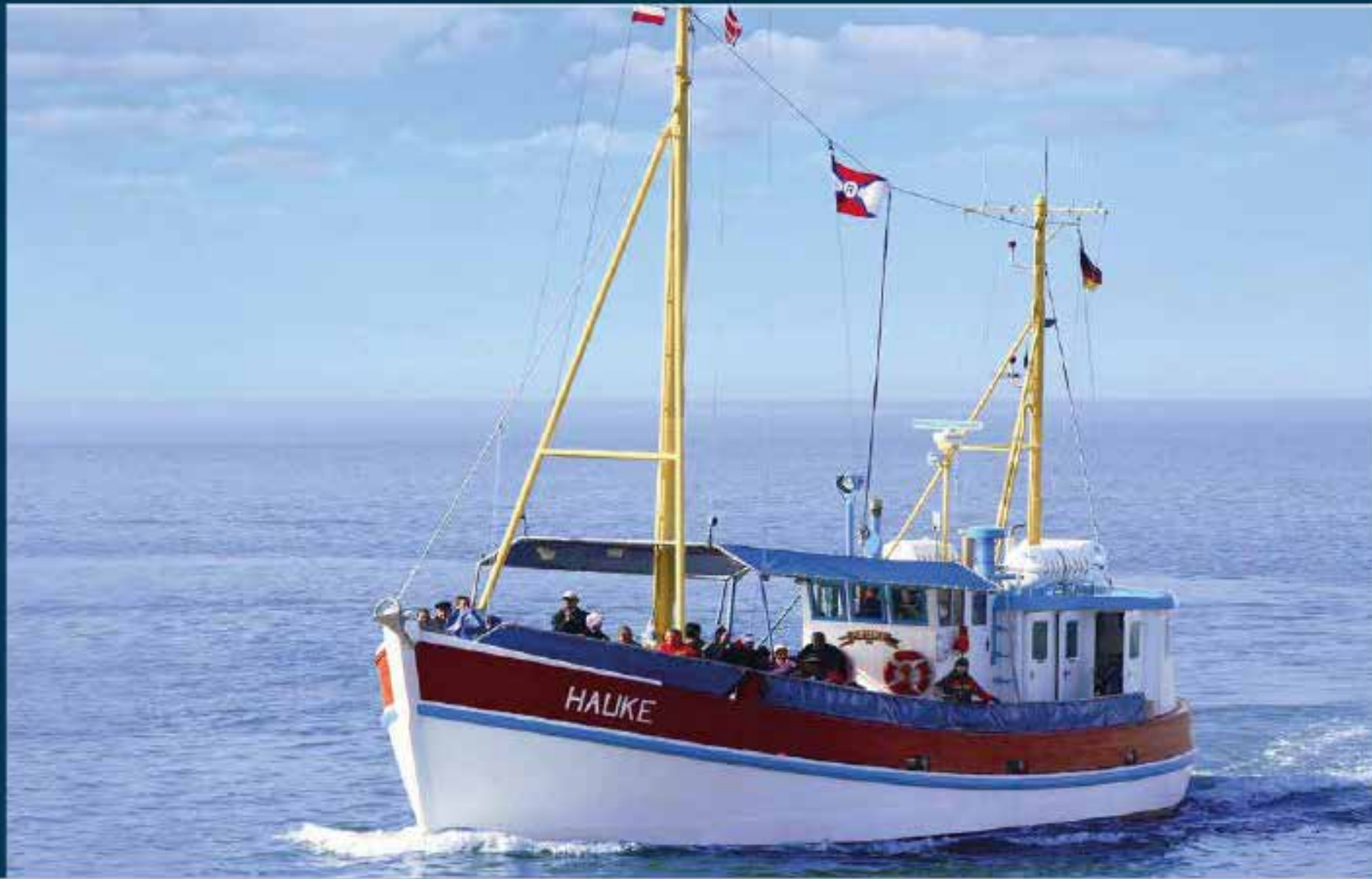
Letzte Ruhestätte See